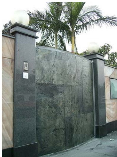
Torverkleidung - Buntschiefer Rutiquee