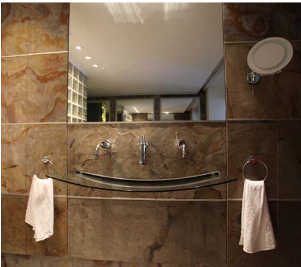
Wandverkleidung - Buntschiefer Rustiquee