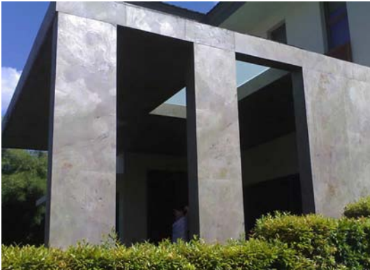
Fassadenverkleidung - Buntschiefer Molte Rosa