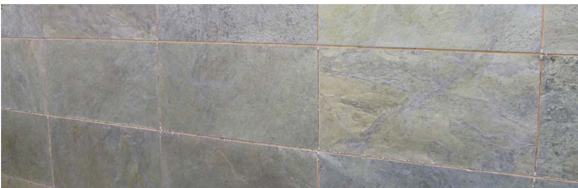
Fassadenverkleidung - Glimmerschiefer Burning forest copper