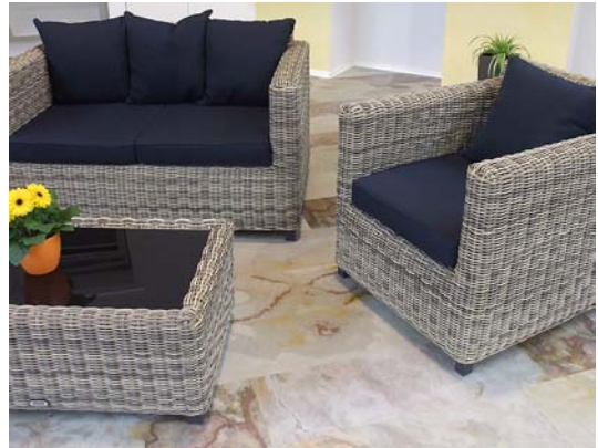
Schieferboden - Buntschiefer Falling leave