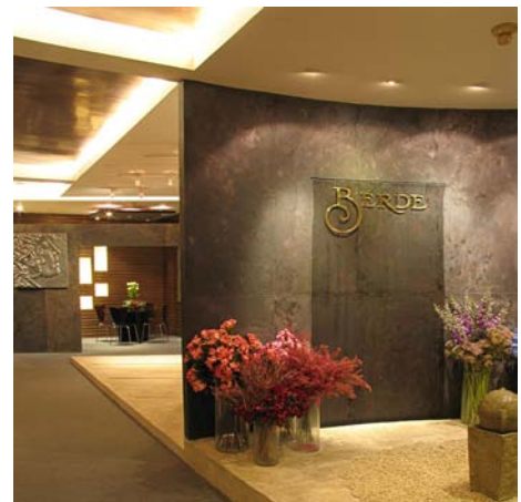
Wandverkleidung - Buntschiefer Terra Rosso