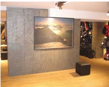
Wandverkleidung - Glimmerschiefer Cobre