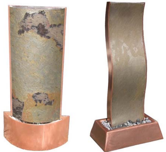
Elementverkleidungen mit Papierschiefer