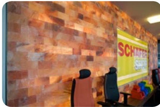
Wandgestaltung als Objektoptimierung