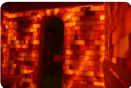
Sauna - Salzsteindekor