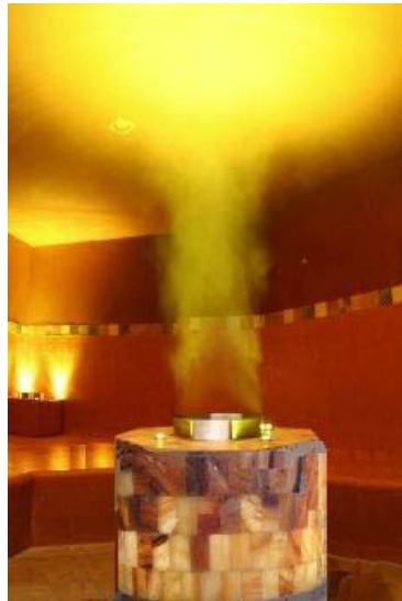
Dampfbad - Ofenverbau