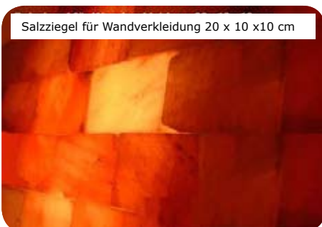
Salzziegel für Wandverkleidung 20 x 10 x 10 cm

Salzfliese 20x10x2 cm (0,87 kg) Salzfliese 20x10x2.5 cm (1,08 kg) Salzfliese 20x20x2.5 cm (2,17 kg)