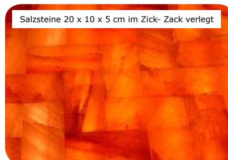
Salzsteine 20 x 10 x 5 cm im Zick- Zack verlegt