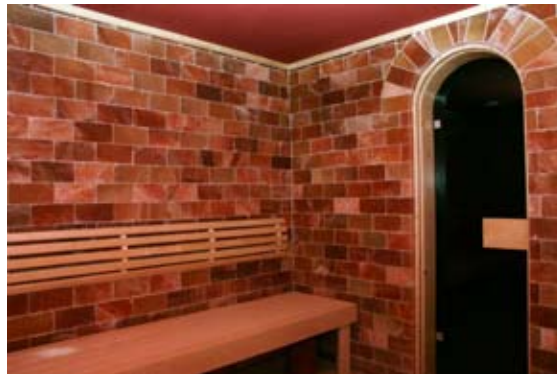
Sauna - Salzziegel Dekor